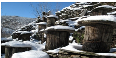
Rucher tronc de Saint Maurice de Ventalon,

Pour la soixantaine de membres de l'association l'Arbre aux Abeilles, un des plus beaux souvenirs reste le plaisir pris par les gens du canton à partager cet événement, à rencontrer des gens venus des quatre coins de France, intéressés par la recherche d'une agriculture nouvelle et de nos traditions agricoles.